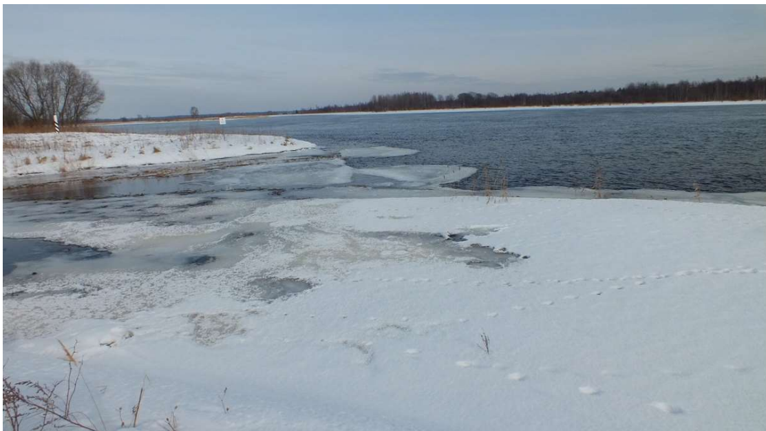
Foto 3. Sissevool Jaama kanalisse, vaade piki Narva jõge allavoolu 8.03.2018.

Mujal on kanali põhi sügavamas kohas projekteerituga ligikaudu võrdne või projekteeritust sügavam (kõrguste vahemik 27.70...28.25). Kaldapiirkonnas on siiski sette kogunemine märgatav. Aastal 2007 koostatud projektis oli põhja kõrguseks kogu