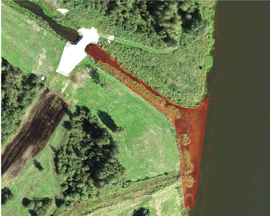
Joonis 4. Settest puhastatav Jaama kanali sissevool

Settest puhastatav ala 5300 m 2 on esitatud ka dwg formaadis vektorfailina (vt joonised JK-1 ja JK-2). Väljakaevatav materjal tuleb kaldale laiali planeerida 0,5 m (max 0,7 m) paksuse kihina. Tööde ehituslik maksumus (sh sette eemaldamine ja planeerimine, järelevalve) on ca 8000 eur+km. Põhiliste ehitustööde mahud ja maksumused on arvestatud tabelis 4.