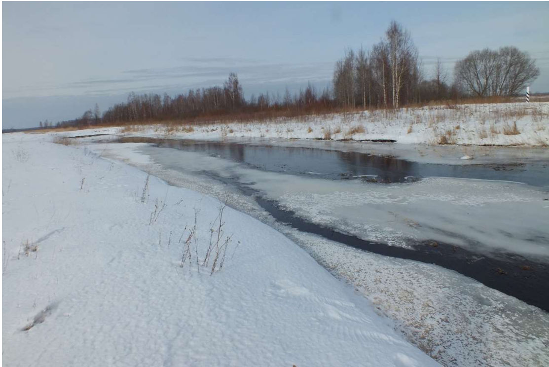
Foto 2. Jaama kanal, vaade sissevoolust allavoolu 8.03.2018.