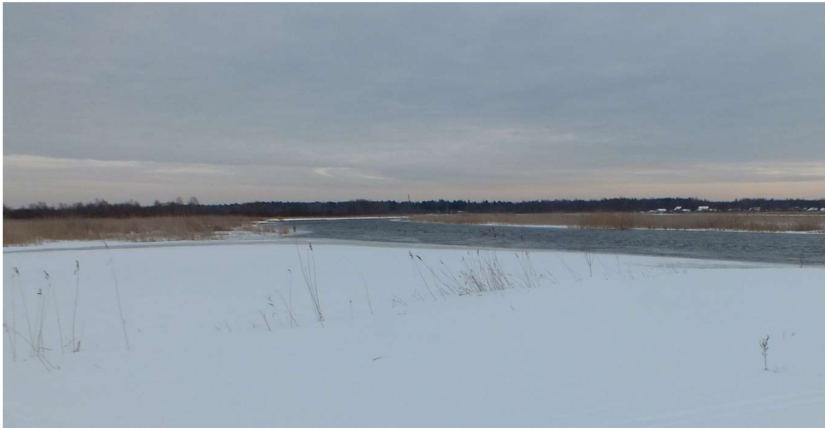
Foto 1. Jaama jõe suue 8.03.2018, Narva jõe haru on jäävaba