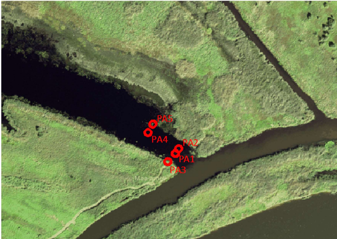
Joonis 3 Puuraukude asukoha skeem