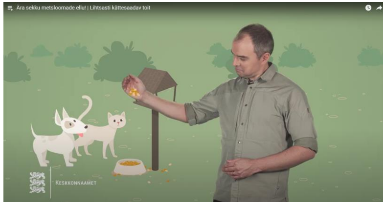
Lihtsasti kättesaadav toit