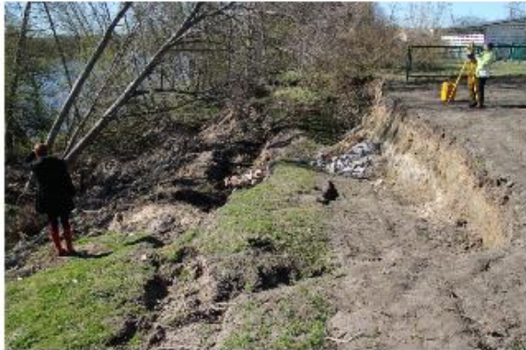
Maalihe. Pärnu jõe alamjooksu kaldad on lihekohtlikud.

https://keskkonnaamet.ee/keskkonnakasutus-keskkonnatasu/keskkonnakorraldus (valida: „Ehitamise kooskõlastamine“, „Planeeringute kooskõlastamine“)