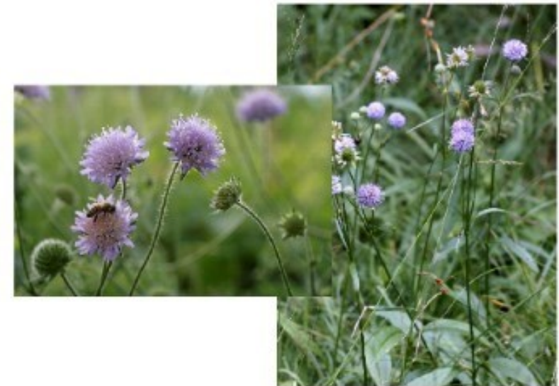
Harilik äiatar ( Knautia arvensis , vasakul) ja peetriteht ( Succisa pratensis )

Kasvukoht: puisniidud ja kuivad niidud (peetriteht esineb lammi-, ranna-, puisniidul ja märgadel niitudel)